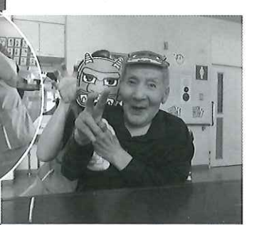
節分でのコマ。オニ役と仲良くツーショット♪