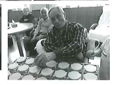
オセロに囲碁に麻雀。どちらに軍配が上がるかな？

永年サニーヒルのみなさん、誠徳園にもご奉仕していただき、ありがとうございます。また、毎月、町内会、支部、役員、お世話の機会が多岐にわたります。ありがとうございます。感謝の念が