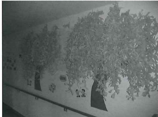
桜が待ち通しくて、利用者様のお力を借りて、東棟廊下に桜の花を咲かせてみました。どう？キレイなもんでしょ？

今年 は 雪 解 け も 早 く、 初 夏 を 思 っ せ る よ う な 気 温 の 上 昇 も あ り、 春 の 訪 れ を 全 身 で 感 じ ら れ る 日 が 続 い て い ま す。 皆 様 は ど う 過 ぎ さ れ て い ま す か？ 利 用 者 の 皆 様 は お 変 わ り な く、 充 実 し た 日 々 を 過 ぎ さ れ て い ま す よ。