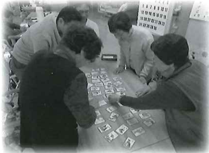
デイサービスかるた大会!