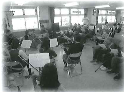
バイオリン教室の生徒さんの演奏に 合わせ歌を歌って楽しいひと時です♪