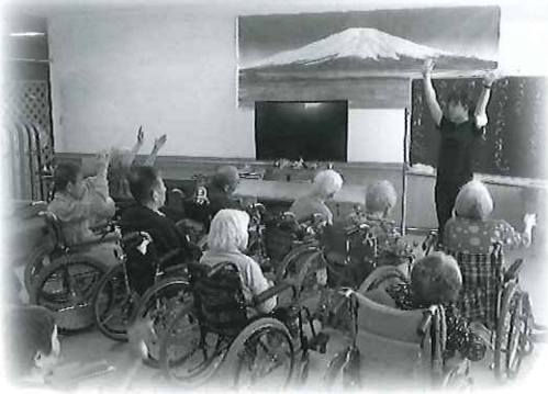
集団体操。体を動かすのが元気の秘訣です♪