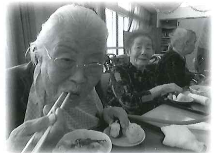
おいしいお鍋に舌鼓♪