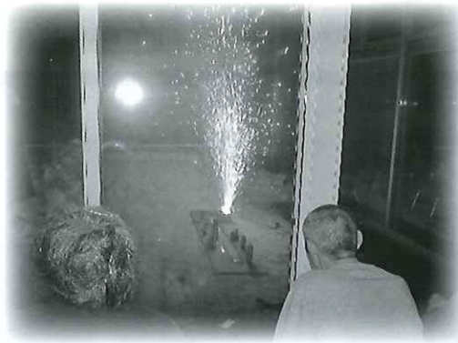
誠徳園花火大会!!冬の花火も綺麗ですね