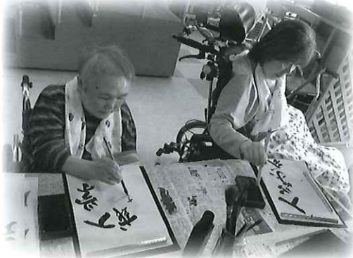
レクリエーション書道

誠徳園ではご利用者様に楽しく過ごして頂くために行事やイベントなども行っております。冬の花火大会や春には花まつりなど色々な行事が日々の生活を彩ります♪