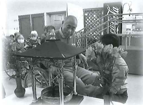
山花まつり 甘茶をお釈迦様にかけて一年の健康を祈ります