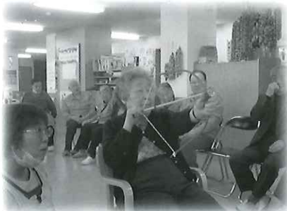
レクリエーション。 真剣な表情でよ〜く狙ってます